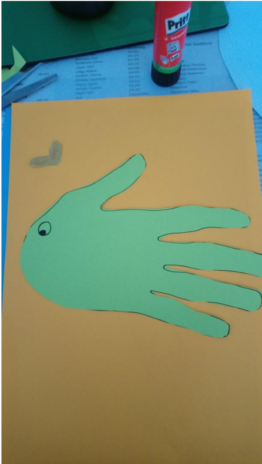
Auge an den Fisch malen und den Mund ankleben