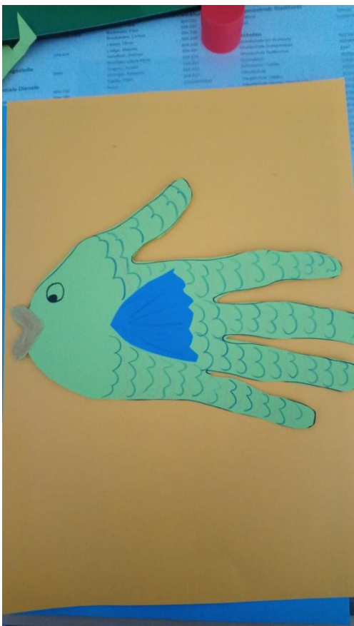
Schuppen malen und Flosse ausschneiden und festkleben