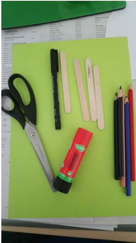
Material: Schere, Kleber, Stifte und Eisstiele, Tonpapier