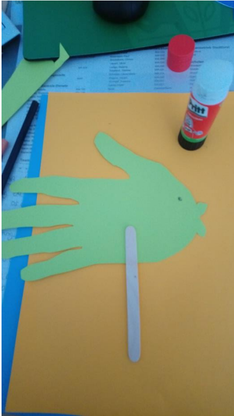
Eisstäbchen an den Fisch kleben