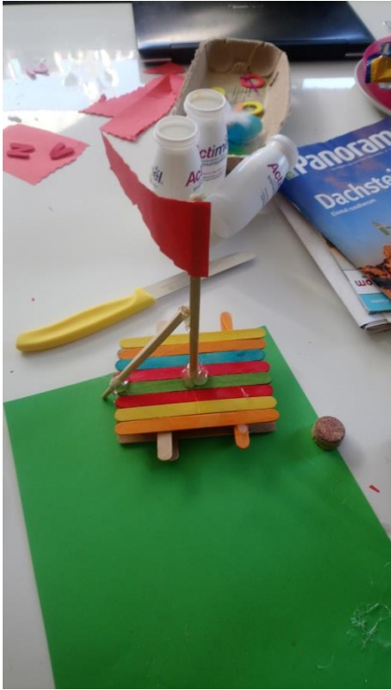
Nun die Stäbchen einmal waagrecht und dann senkrecht bekleben