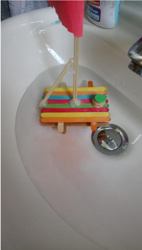
Es Schwimmt auf zu neuen Abenteuern!!!